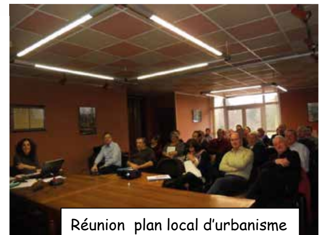
Réunion plan local d'urbanisme