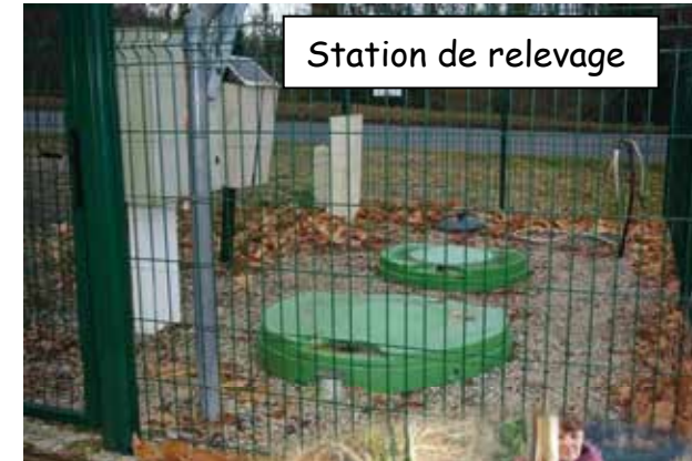
Station de relevage