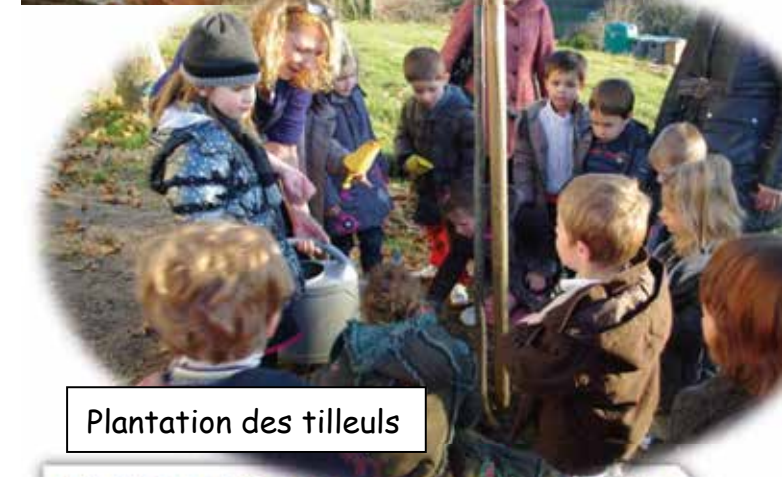
Plantation des tilleuls