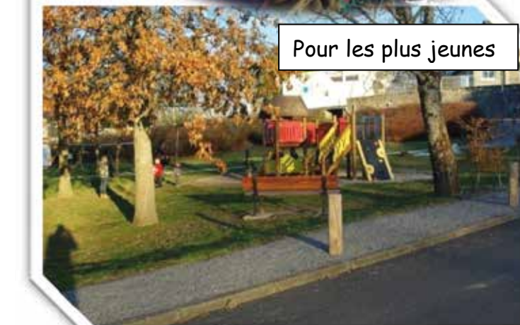
Pour les plus jeunes