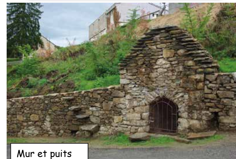
Mur et puits