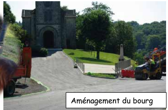
Aménagement du bourg